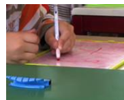
Graphisme et écriture