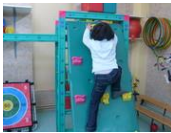
Agir, s'exprimer, comprendre à travers l'activité physique