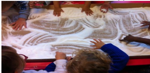
Sel fin et support horizontal

Des variables : la matière, les supports.