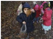
Explorer le monde vivant, des objets et de la matière