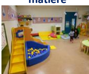
La scolarisation des enfants de moins de 3 ans

http://eduscol.education.fr/pid33040/programmes-et-ressources-pour-le-cycle-1.html