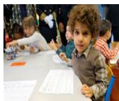
Mobiliser le langage dans toutes ses dimensions

Des ressources scientifiques, didactiques et pédagogiques pour aider à la mise en œuvre du programme sous forme de pistes concrètes, de vidéos de situations de classe, et de supports pour organiser la progressivité des apprentissages (EDUSCOL).