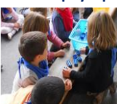
Jouer et apprendre