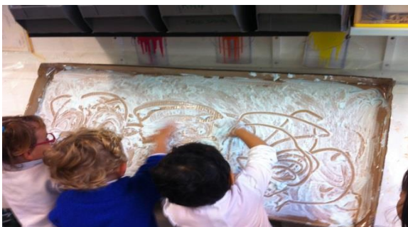
Gel à raser, gouache et piste horizontale

« Laisser une trace dans cette nouvelle vie de l'enfant peut être identifié comme un engagement de celui-ci : une révélation de son identité au sein du groupe classe. C'est une étape. Elle doit se produire dans le bien-être ». A.G PEMF.