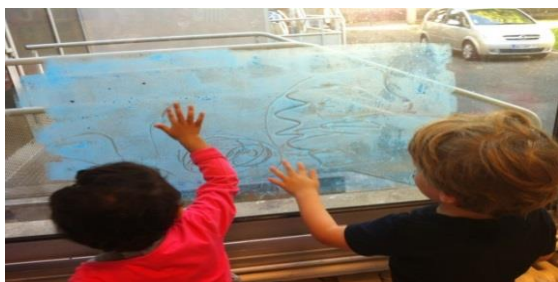
Gouache sur vitre et support vertical

« A quelques jours de la rentrée, mon objectif est de proposer des activités attrayantes pour inviter tous les élèves dans une situation de découverte et susciter une intervention volontaire de chacun. Pour cela, je conçois des pistes graphiques dont les supports et les matières provoqueront à priori la surprise, l'étonnement et la curiosité ».